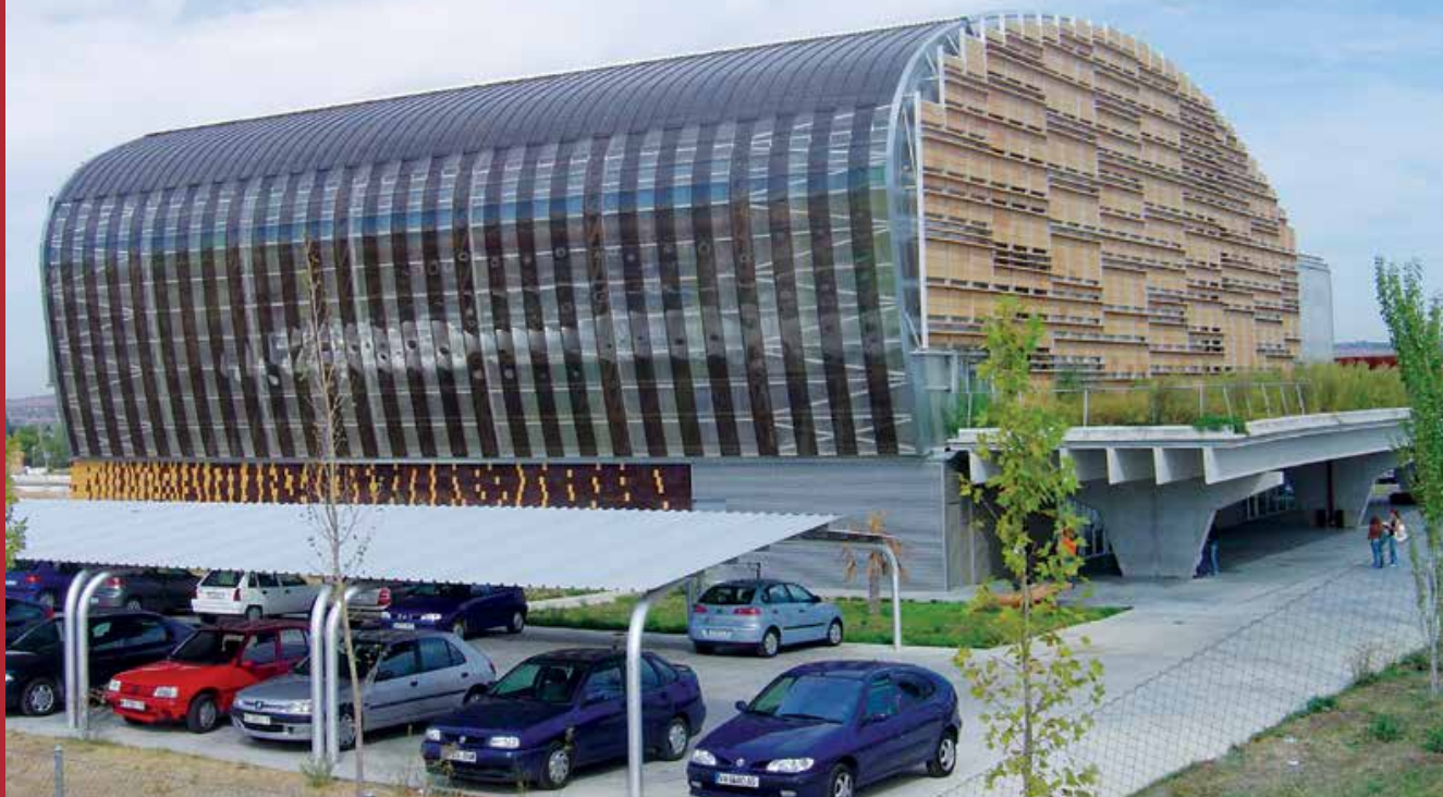
Edificio de Oficinas, España | Danpal® Compacto | Arquitecto: Pich Aguilera