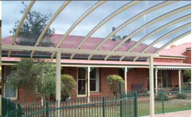
Residencial, Danpal® Compacto, Sydney Australia