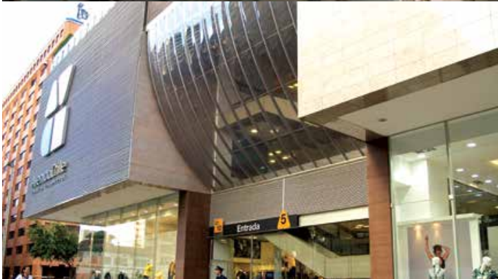
Centro Comercial Av Chile, Colombia | Danpal® Compacto