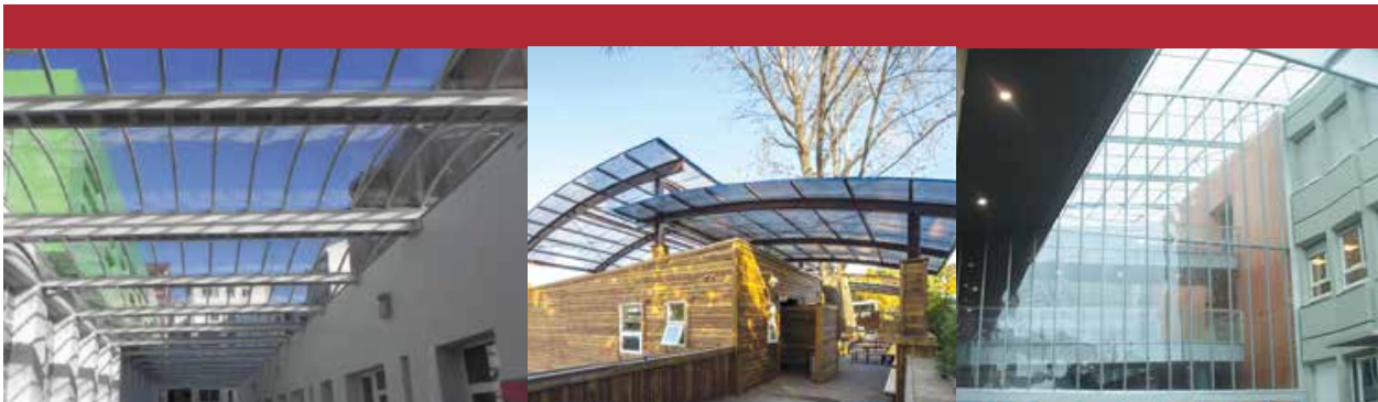
Colegio Zankoeta, España Danpal® Compacto Arquitecto: Mentxaka