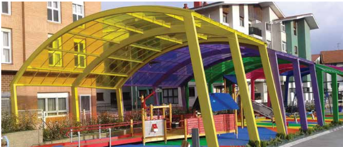
Parque de juegos, España | Danpal® Compacto | Arquitecto: Kepa Sacristan